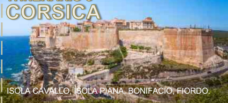
ISOLA CAVALLO, ISOLA PIANA, BONIFACIO, FIORDO.