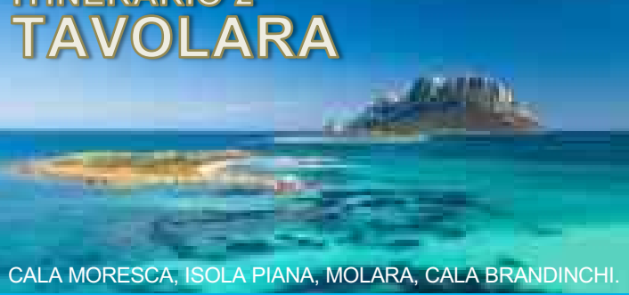
CALA MORESCA, ISOLA PIANA, MOLARA, CALA BRANDINCHI.