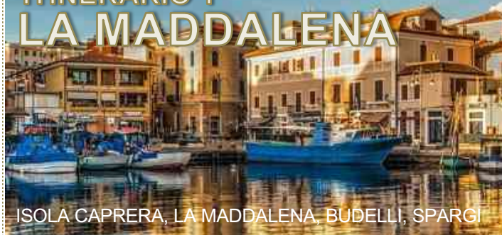
ISOLA CAPRERA, LA MADDALENA, BUDELLI, SPARGI